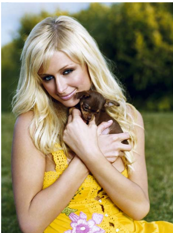
Пэрис Хилтон с собачкой породы чихуахуа

Итак, по мнению парня, собака нашим героям не пойдёт . То есть не подойдёт, не нужна. И подруга предлагает завести кошку: